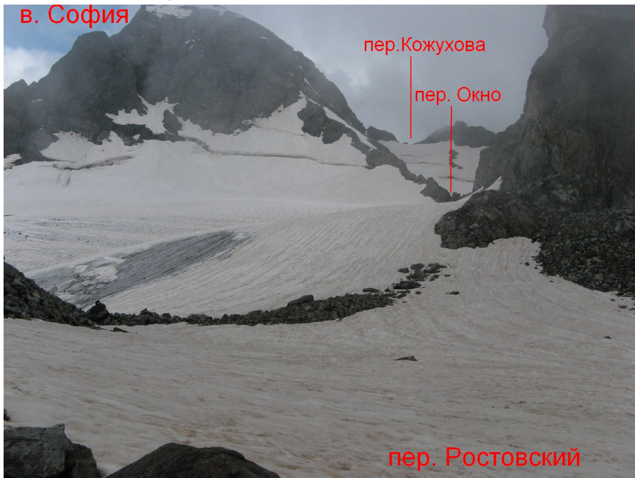
Фото 4. Вид на Софийский ледник с перевальной седловины пер. Ростовский

С пер. Ростовский на пер. Окно надо идти по леднику ~800м, вправо по ходу движения, вдоль скальной гряды, с небольшим набором высоты. Пер. Окно имеет характерную форму и находится в этой скальной гряде, в данном месте уже разделяющей два ледника (Софийский и Ак-Айры). Со стороны Софийского ледника высота подъема колеблется от 5 до 20 м, в зависимости от состояния снега.