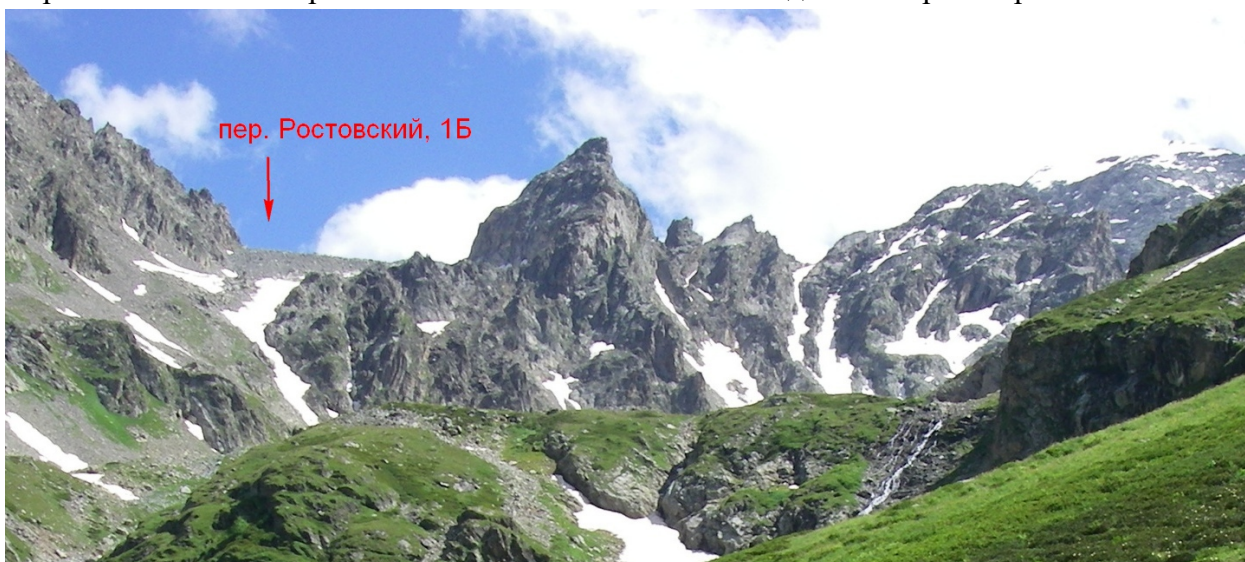
Фото 1. Вид на пер. Ростовский с верхней части водопадов Ак-Айры, не доходя (ниже) Спартаковских ночевок.

Здесь дается описание подъема на перевал от Спартаковских ночевок. Перевальный взлет пер. Ростовский снежно-осыпной. Седловина ярко выраженная.