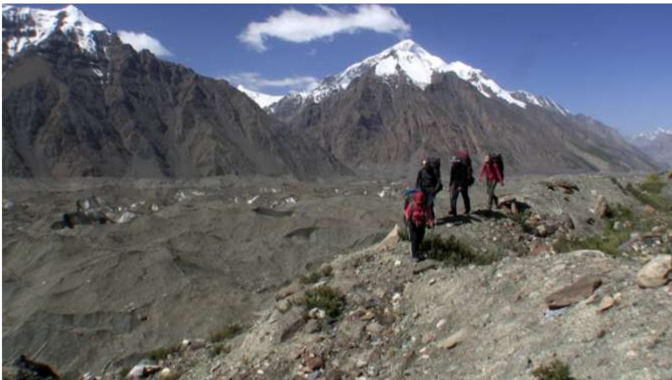
Фото 52. Цирк разведки