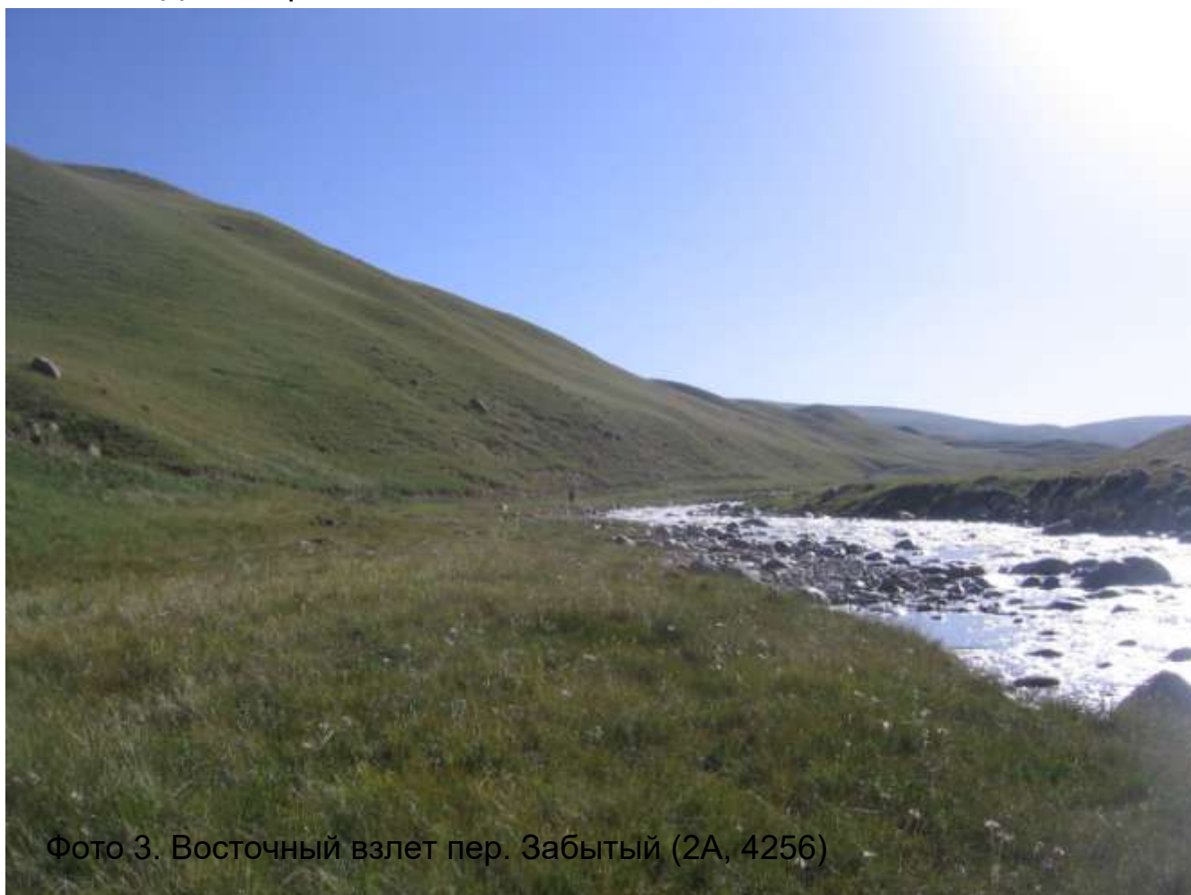
Фото 3. Восточный взлет пер. Забытый (2А, 4256)