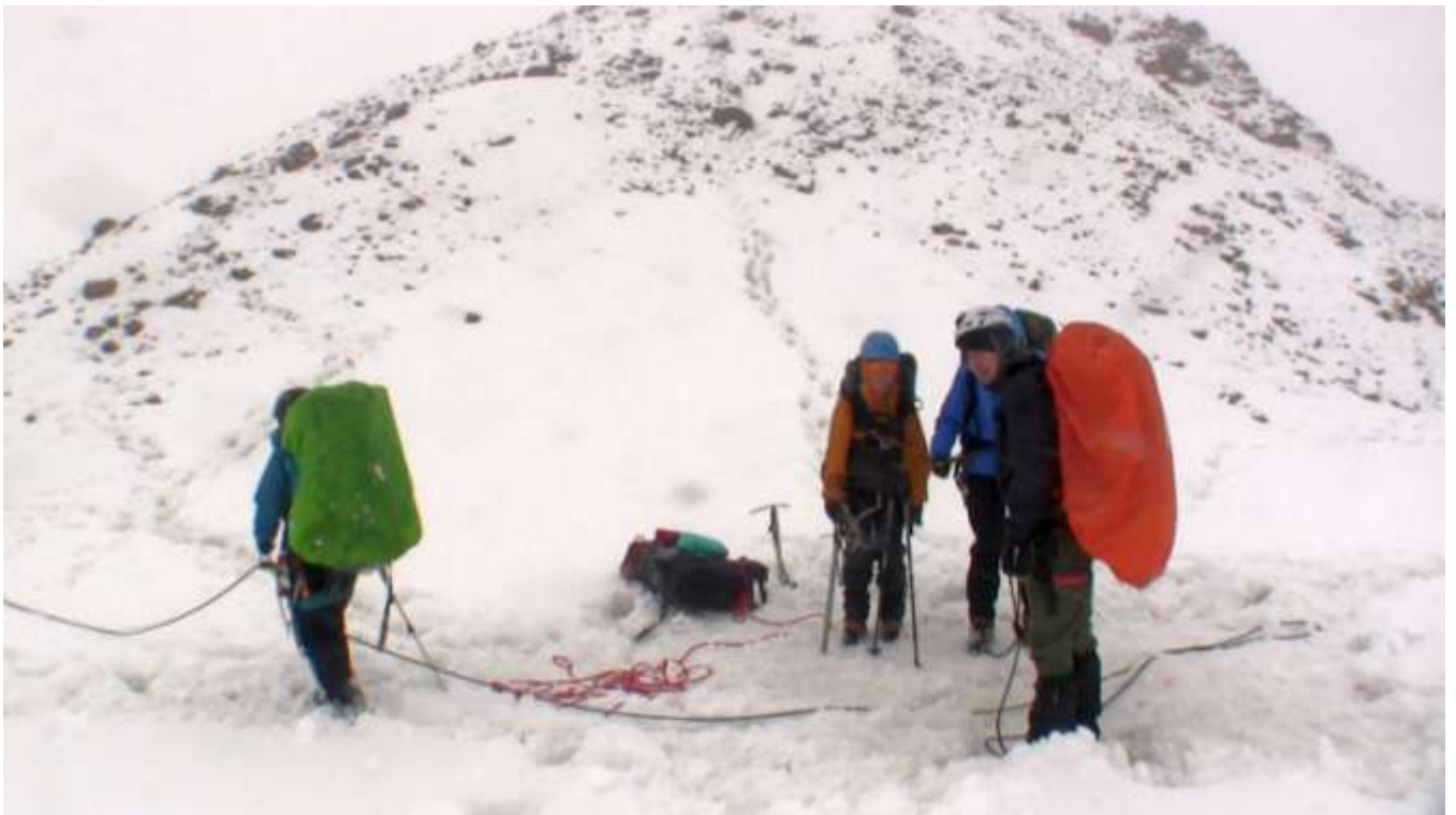
фото 6. Спуск с пер. Забытый на запад