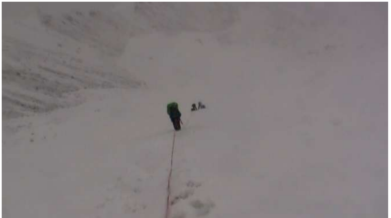
фото 5. Седловина пер. Забытый