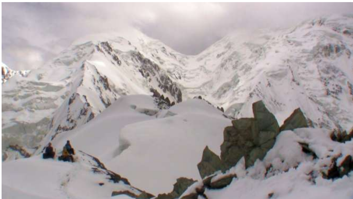
Фото 22. Начало спуска с пер. Разведочный на запад