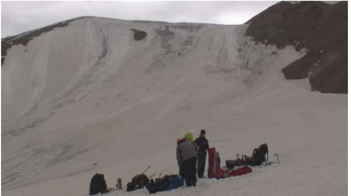
Фото 4. Подъем на пер. Забытый