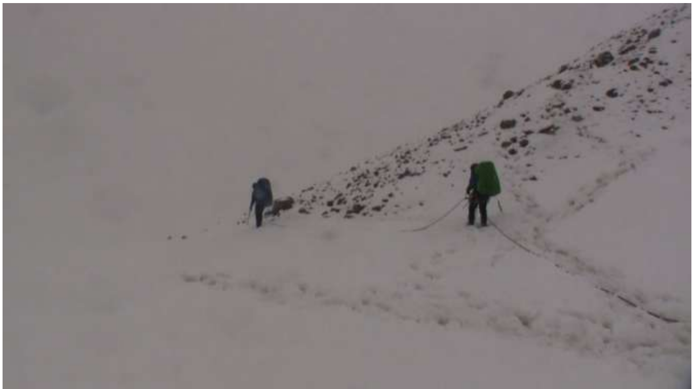
фото 7. Долина пер. Глиняных Духов