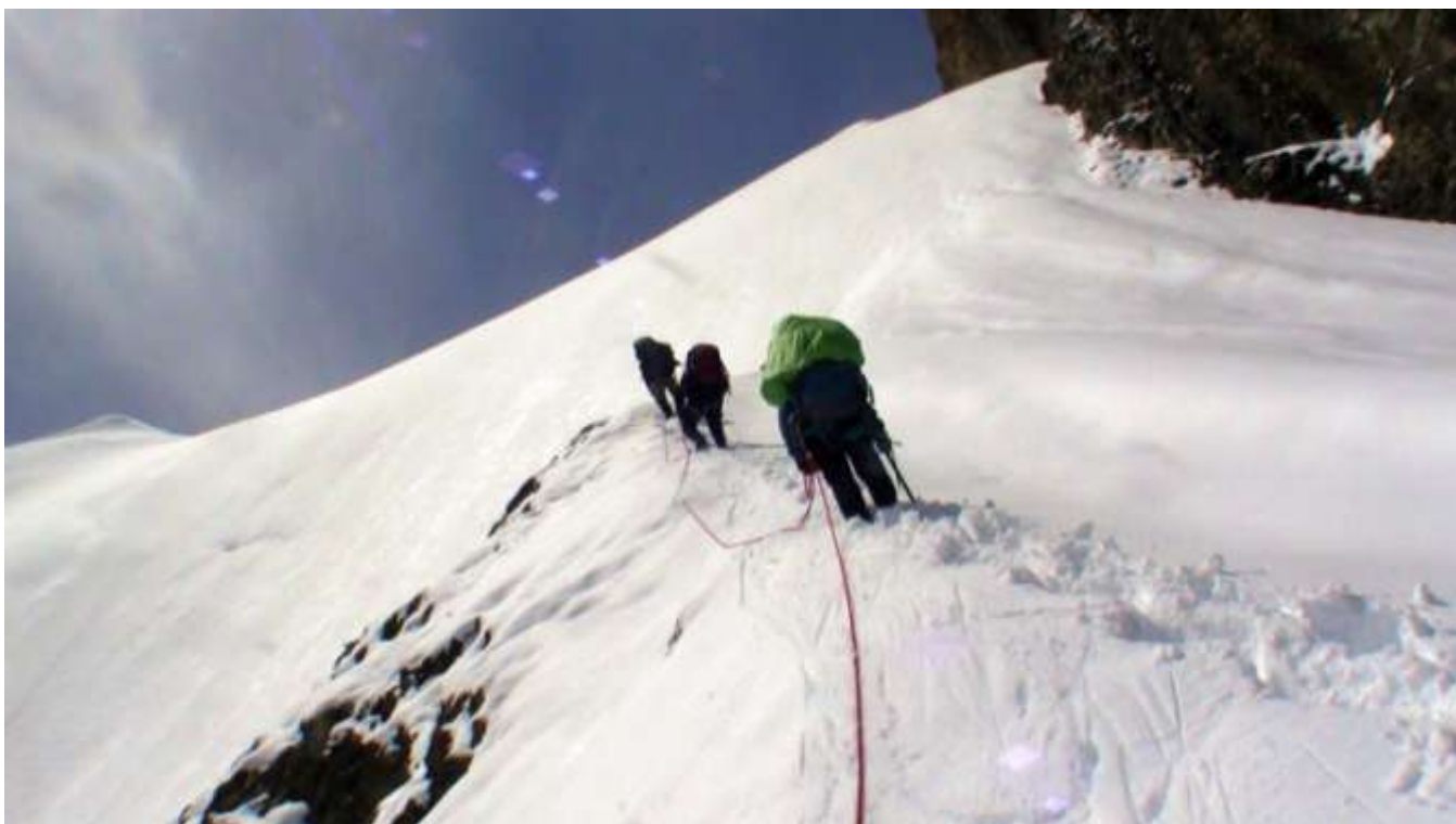
Фото 20. Подъем на пер. Разведочный, перила на ключевом участке.