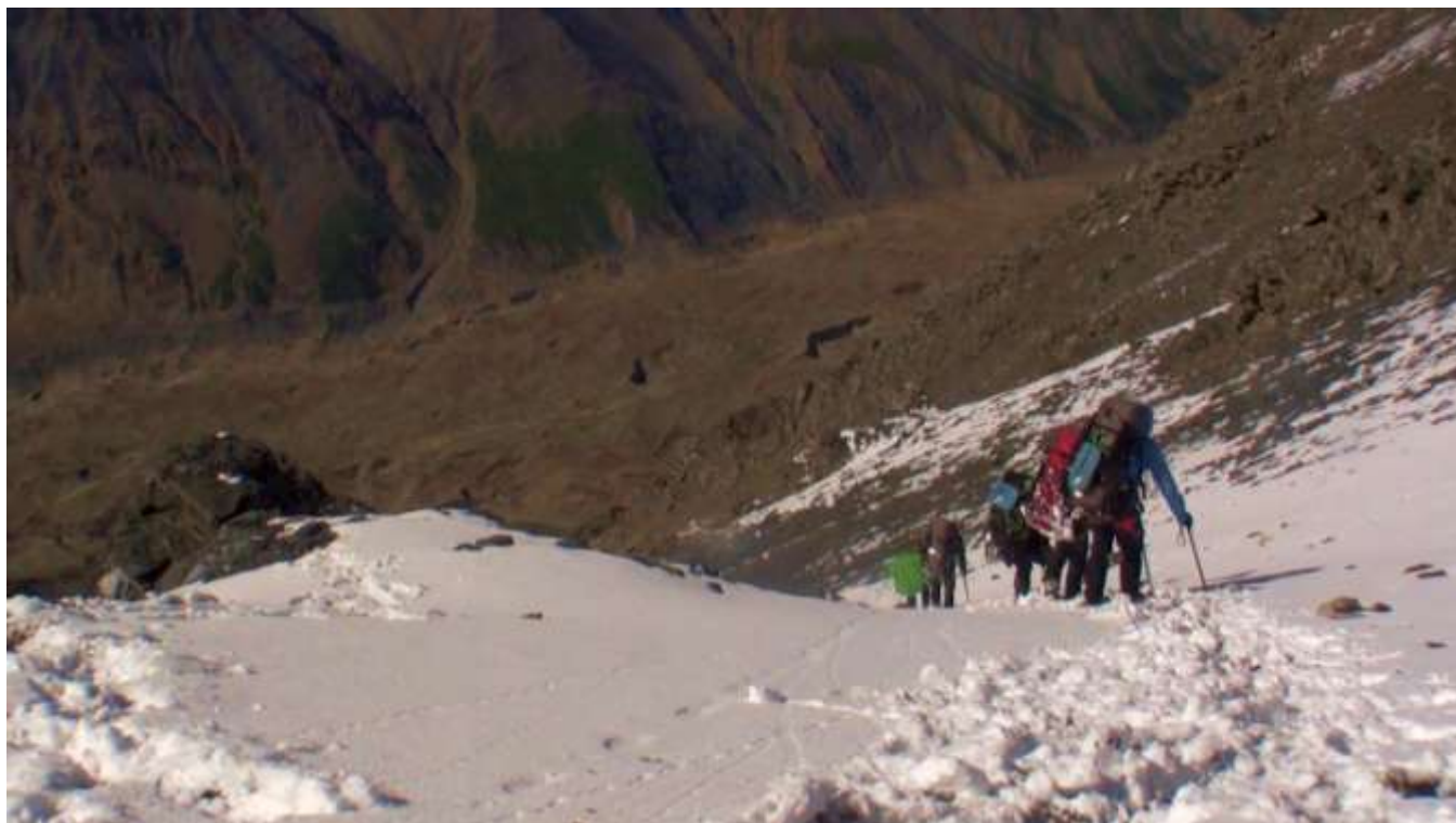
Фото 44. Спуск с пер. Двух жандармов на юг