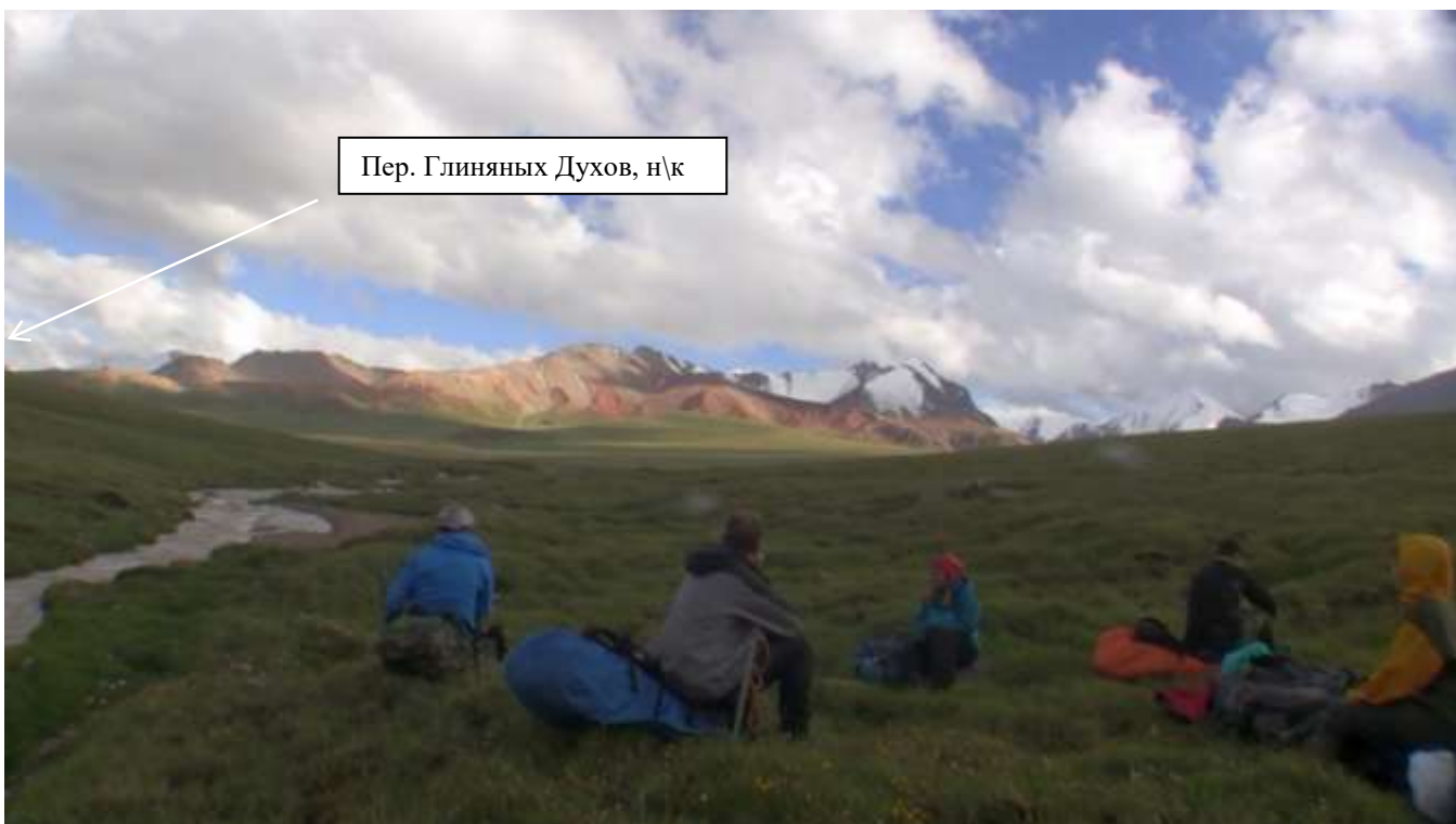
фото 8. Подъем на пер. Глиняных Духов (н/к, 3510,п/п)