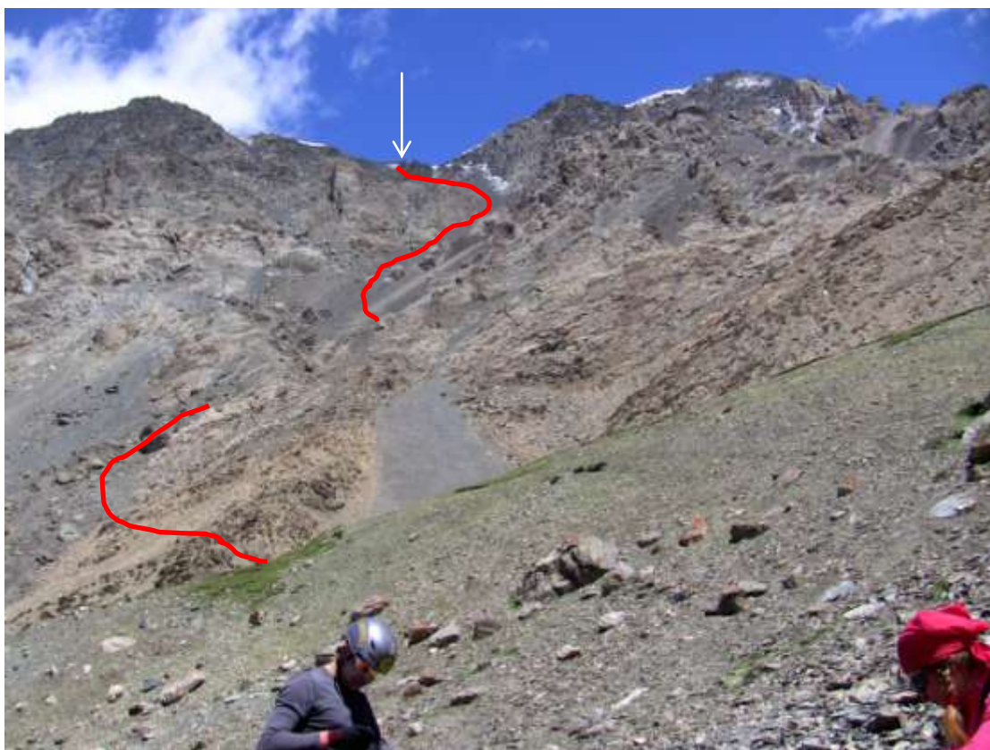
Фото 46. Травянисто – осыпное ребро, спуск на ледн. Ю. Иныльчек