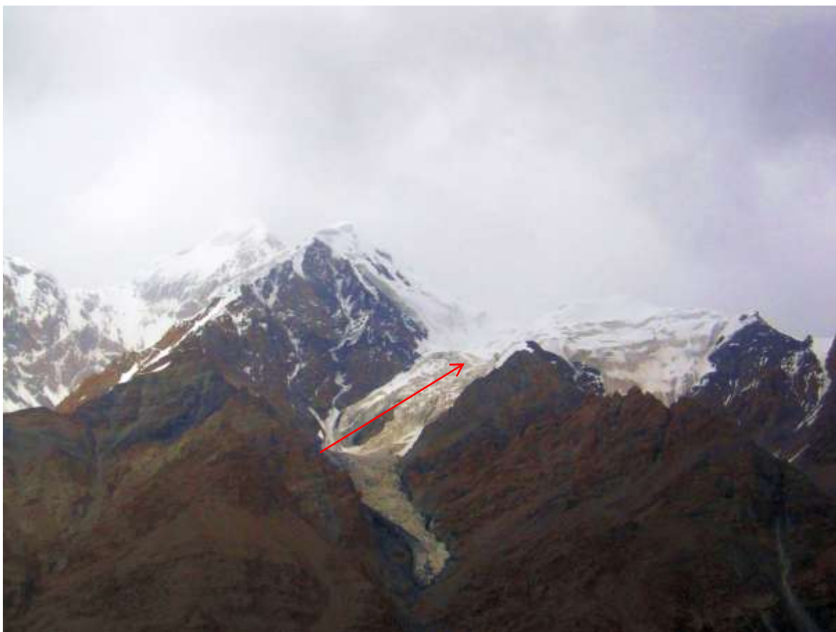
Фото 60. Пересечение ледн. Ю. Иныльчек к левому борту